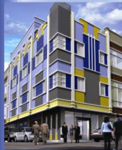
Kantor Pusat PT. PDC