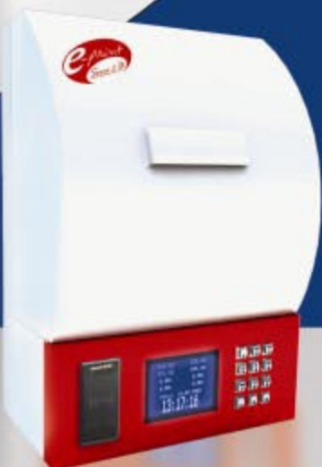
Tiket Printer Merah Putih e-print dengan LCD Besar