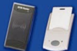
Card Reader & Writer

Membantu manajemen dalam menjalankan Bisnis SPBU