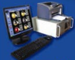
Industrial PC Server