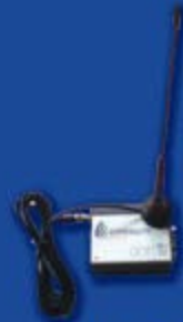
Modem HP GSM